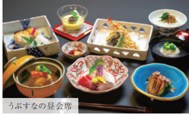
うぶすなの昼会席

1つ1つ丁寧にこだわった季節の食材を味わう会席料理です。懐かしい空間の中、ゆったりとした時間をお過ごしいただけます。