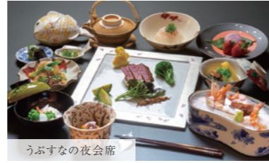
うぶすなの夜会席