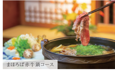
まほろば赤牛鍋コース

「まほろば赤牛」は、赤身と脂身のバランスが良く、お肉の旨味がしっかりとしています。料理長こだわりの出汁と合わせた「すきしゃぶ」と「しゃぶしゃぶ」のどちらかお好みの食べ方でお楽しみくださいませ。