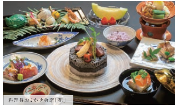
料理長おまかせ会席「花」

※仕入れによってメニューが変更となる場合がございます 詳細はお問い合わせください